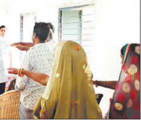
बाल विवाह न करने शायद लेते लोग।

हरिभूमि न्यूज ▶▶ अकलता ग्राम पंचायत कोटगढ़ की ग्राम सभा बैठक में बाल विवाह निषेध प्रस्ताव सर्वसम्मति से पारित कर ऐतिहासिक निर्णय लिया गया है। पंचायत प्रतिनिधियों के द्वारा इस निर्णय के