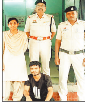
■ आरोपी युवक को गिरफ्तार कर पॉक्सो एक्ट में भेजा रिमांड