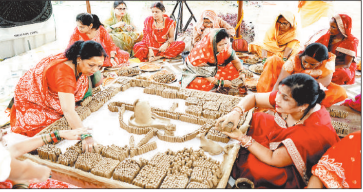
हरिभूमि न्यूज | जशपुरनगर

श्रावण मास पर श्रीफलेश्वर महादेव मंदिर बगिया में 1 लाख 108 पार्थिव शिवलिंग निर्माण एवं विशेष पूजन अनुष्ठान का भव्य शुभारंभ हुआ। यह आयोजन तीन दिवसीय धार्मिक महोत्सव के रूप में 22 से प्रारंभ होकर 24 जुलाई तक चलेगा।