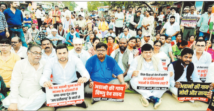
हरिभूमि न्यूज | जशपुरनगर

कांग्रेस ने आज पूरे प्रदेश में नाकेबंदी एवं चक्काजाम दोपहर 12 बजे से 2 बजे के बीच में किया। ईडी के द्वेषपूर्ण कार्रवाई को लेकर प्रदेश कांग्रेस के निर्देश जिले में जिला स्तरीय चक्का जाम का कार्यक्रम हुआ।